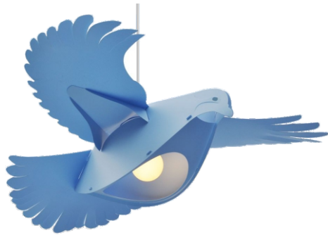
Les 6 parties de la colombe The 6 pieces of the dove

For this light, we recommend an E27 bulb type LED (20W max)